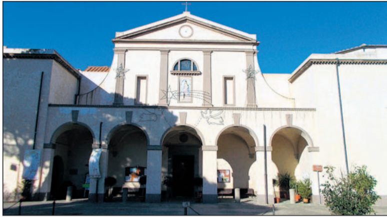
San Romano sanktuarium.

W XVIII w. drewniany kościół pw. św. Klemensa był już na tyle podupadły, zniszczony, zrabowany, po zawierusze wojny trzydziestoletniej i po szwedzkim potopie, że wołał o ratunek. W tej sytuacji, ówczesny proboszcz łędzińskiej parafii, ks. Piotr Bieroński (rodem z Bierunia), we współpracy z zarządcą folwarku kłudzkiego, szlachcicem, protestantem, Piotrem Wehowskim, podjęli wspólną decyzję o odbudowie „bardzo wāt-