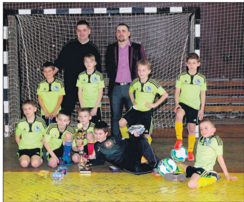
Zwycięski zespół Akademii Sportu KSB.