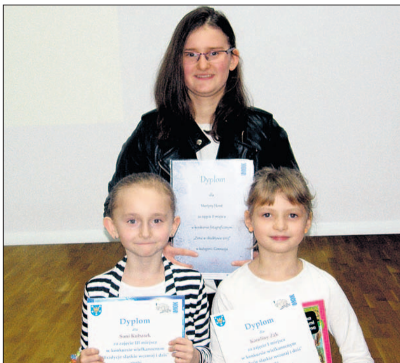
Laureatki konkursów organizowanych przez MOK.