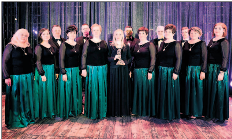
Pro Arte et Musica.