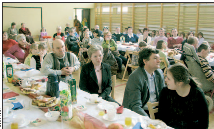
Przed biesiadą goście obejrżeli jasełka.