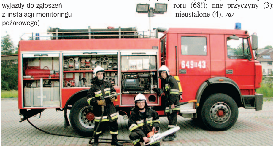
Łędzińscy strażacy przy swoim bojowym „IVECO”.

nieostrożność osób dorosłych przy posługiwaniu się ogniem otwartym, w tym papierosy i zapałki (3); wady urządzeń i instalacji elektrycznych – przewody, sprzęt oświetlenia, odbiorniki bez urządzeń grzewczych (3); wady urządzeń ogrzewczych na paliwo stałe (1); nieprawidłowa eksploatacja urządzeń ogrzewczych na paliwo stałe (3); wylądowania atmosferyczne (1); podpalenia (umyślne) w tym akty terroru (68!); nne przyczyny (3); nieustalone (4). /G/