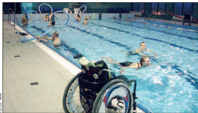
Zajęcia hydroterapeutyczne odbywają się co czwartek.