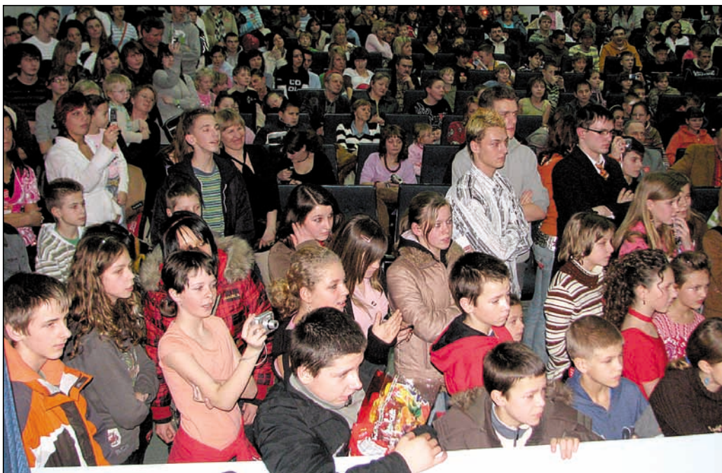
Widzowie szczerze wypełnili salę kina "Piast".