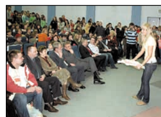
Aukcja na rzecz WOŚP.