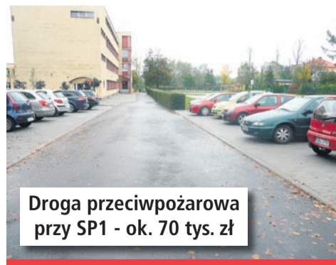
Droga przeciwpożarowa przy SP1 - ok. 70 tys. zł