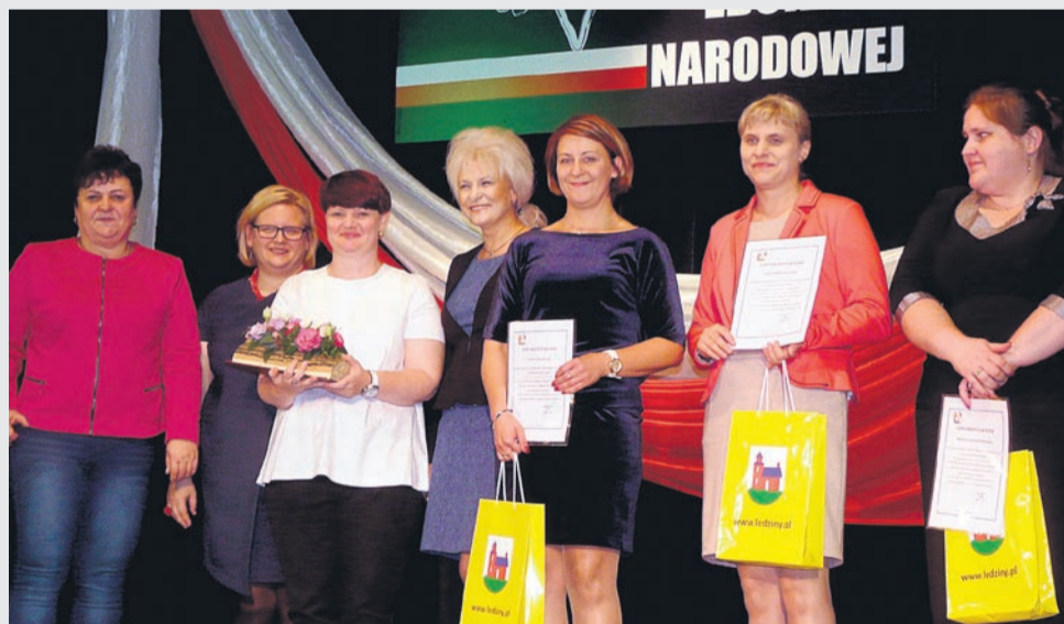
Gimnazjum nr 1