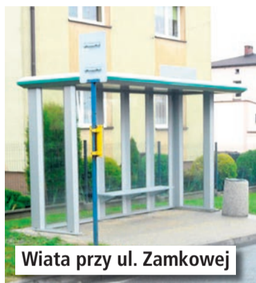
Wiata przy ul. Zamkowej