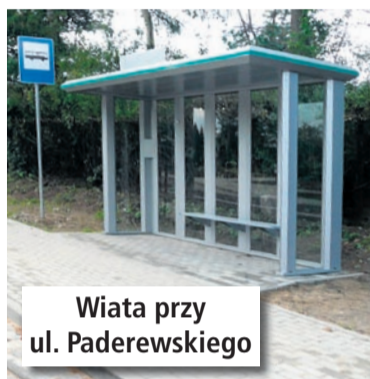
Wiata przy ul. Paderewskiego