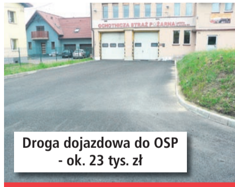
Droga dojazdowa do OSP - ok. 23 tys. zł