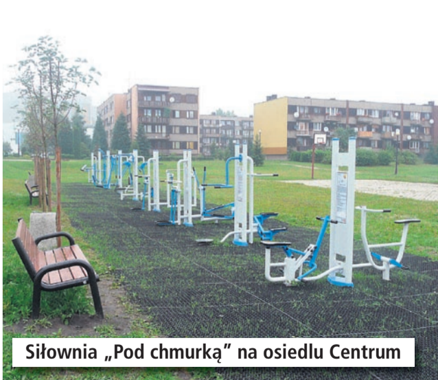
Siłownia „Pod chmurką” na osiedlu Centrum

W ramach Budżetu Obywatelskiego 2016 spełniono oczekiwania mieszkańców poprzez zrealizowanie następujących zadań: