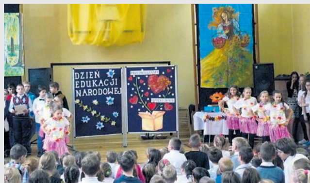
Szkoła Podstawowa nr 1 z oddziałami integracyjnymi