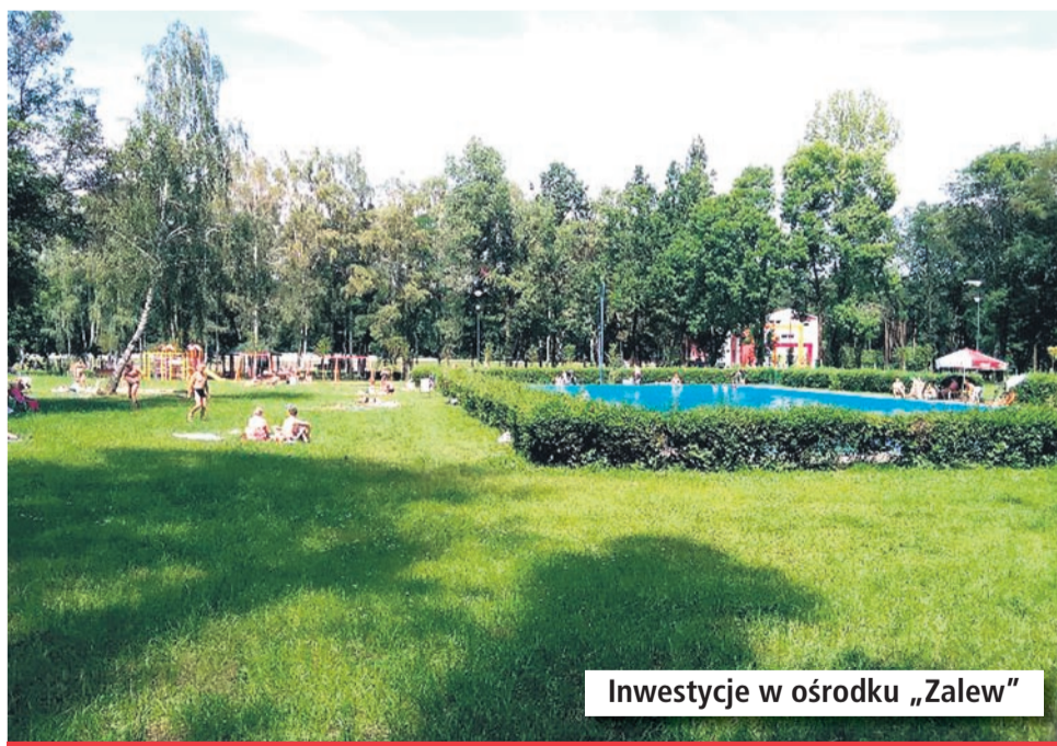
Inwestycje w ośrodku „Zalew”

Na terenie Ośrodka Wypoczynkowo - Rekreacyjnego „Zalew” w 2015 roku wykonane zostały nowe inwestycje. W ramach programu „Budowa infrastruktury okółoturystycznej Ośrodka Rekreacji Sportowej Zalew w Lędzinach w celu podniesienia atrakcyjności turystycznej regionu” wykonane zostały prace ogrodnicze i zdobnicze, wybudowano oświetlone alejki spacerowe, postawiono ławeczki i posadzono zielen. Poza tym oświetlony został skatepark, a obok niego po-