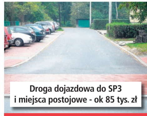
Droga dojazdowa do SP3 i miejsca postojowe - ok 85 tys. zł