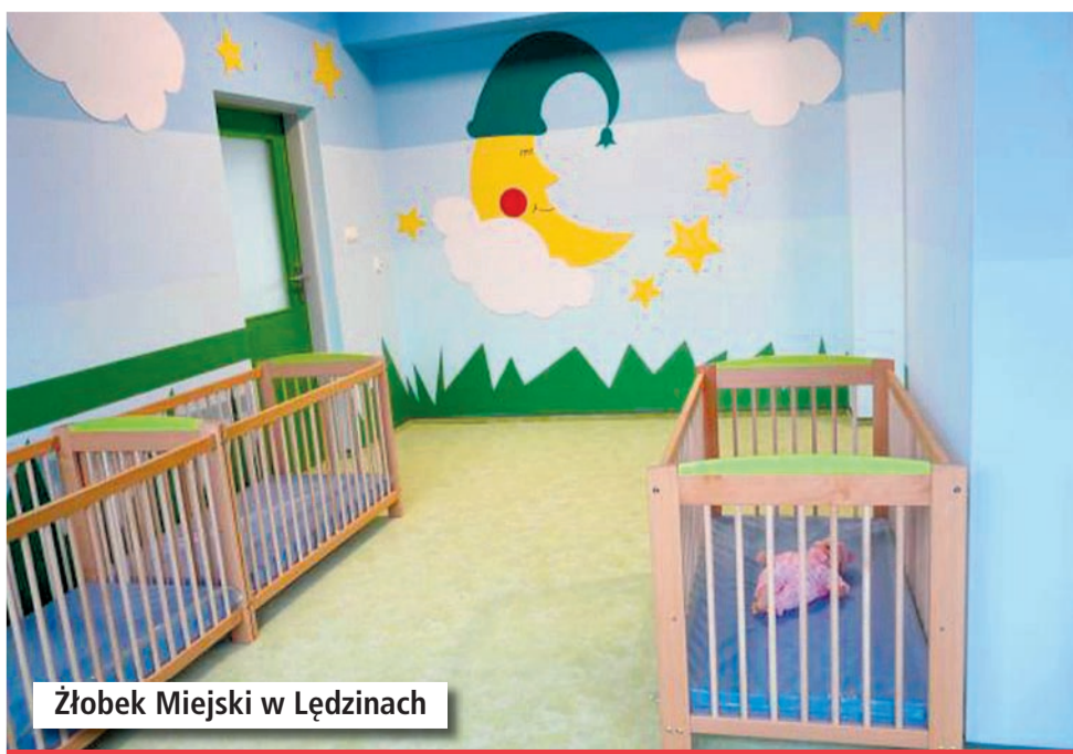
Żłobek Miejski w Lędzinach