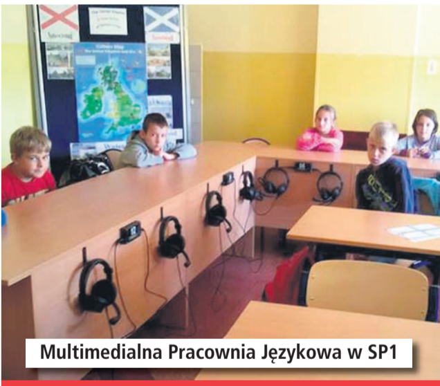
Multimedialna Pracownia Językowa w SP1