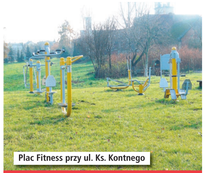
Plac Fitness przy ul. Ks. Kontnego