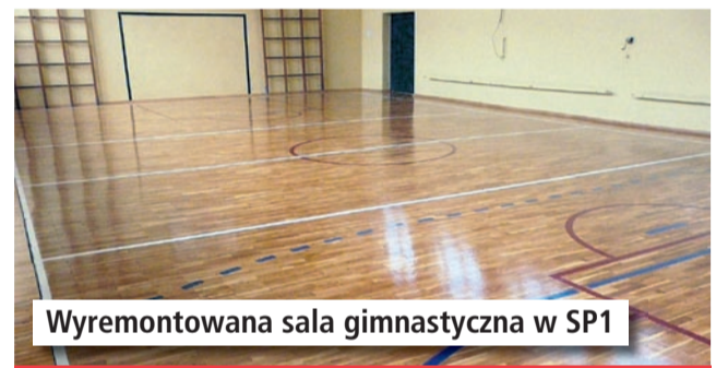
Wyremontowana sala gimnastyczna w SP1

W roku 2016 sporo inwestycji poczyniono także w placówkach oświatowych. Do najważniejszych z nich należą: