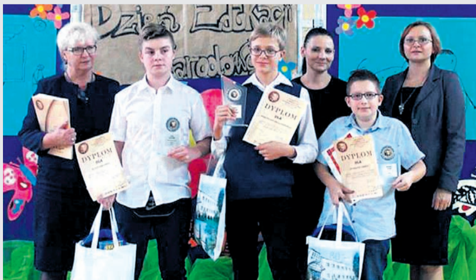
Gimnazjum nr 2 z oddziałami integracyjnymi