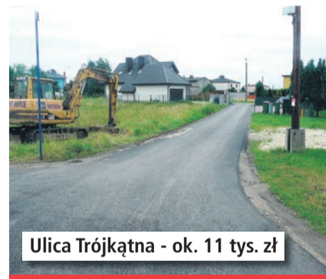
Ulica Trójkątna - ok. 11 tys. zł