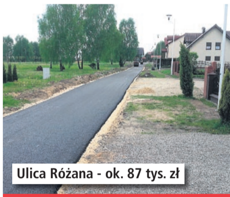
Ulica Różana - ok. 87 tys. zł