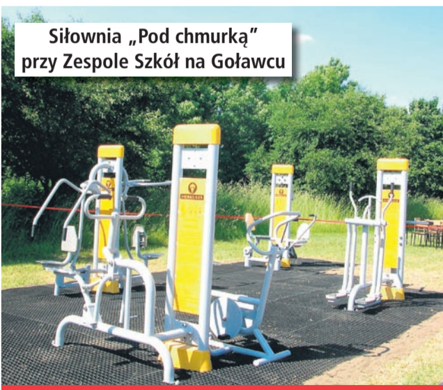
Siłownia „Pod chmurką” przy Zespole Szkół na Goławcu