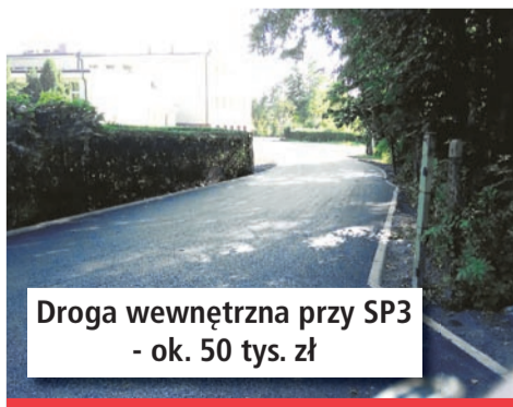
Droga wewnętrzna przy SP3 - ok. 50 tys. zł