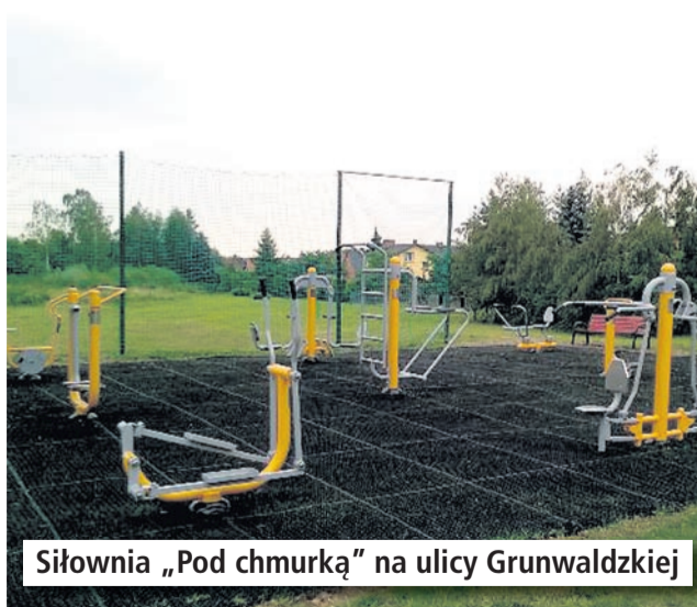
Siłownia „Pod chmurką” na ulicy Grunwaldzkiej