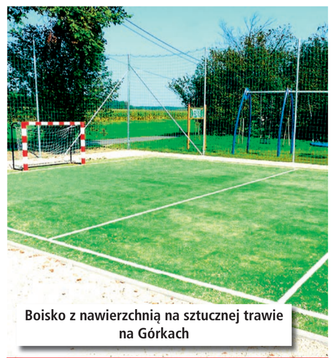
Boisko z nawierzchnią na sztucznej trawie na Górkach