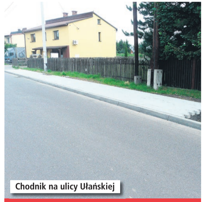
Chodnik na ulicy Ułańskiej