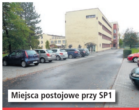
Miejsca postojowe przy SP1