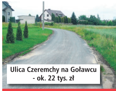
Ulica Czeremchy na Goławcu - ok. 22 tys. zł