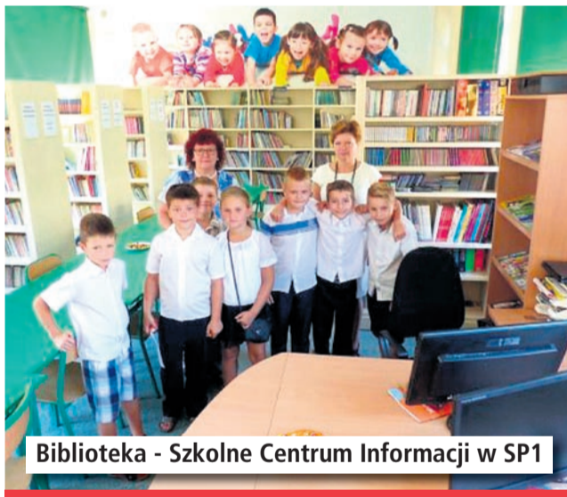
Biblioteka - Szkolne Centrum Informacji w SP1