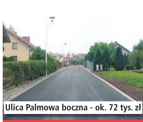
Ulica Palmowa boczna - ok. 72 tys. zł