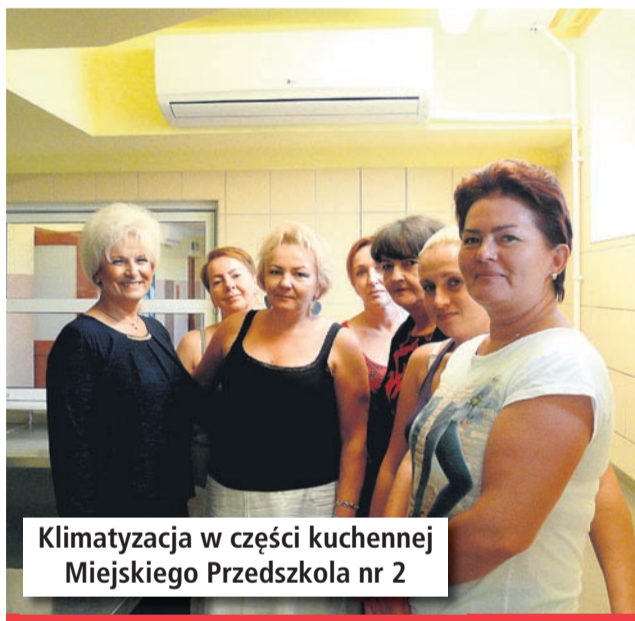
Klimatyzacja w części kuchennej Miejskiego Przedszkola nr 2