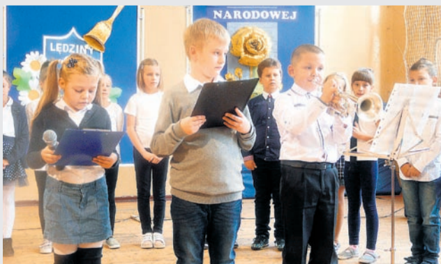
Szkoła Podstawowa nr 3