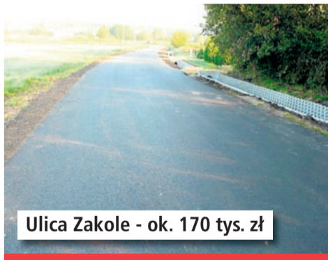
Ulica Zakole - ok. 170 tys. zł