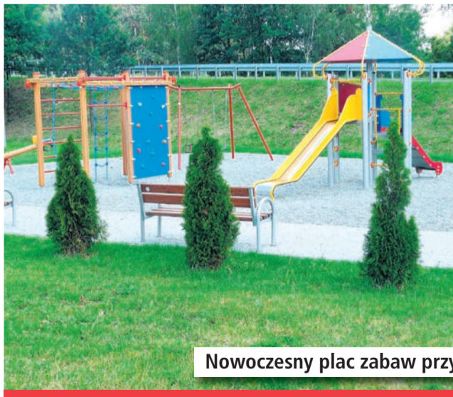
Nowoczesny plac zabaw przy wiadukcie na ul. Murckowskiej