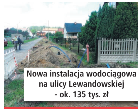
Nowa instalacja wodociągowa na ulicy Lewandowskiej - ok. 135 tys. zł

Rok 2016 to przede wszystkim wiele inwestycji infrastrukturalnych, których celem ma być poprawa bezpieczeństwa i jakości życia mieszkańców. Remontom poddane były następujące drogi: Różana,