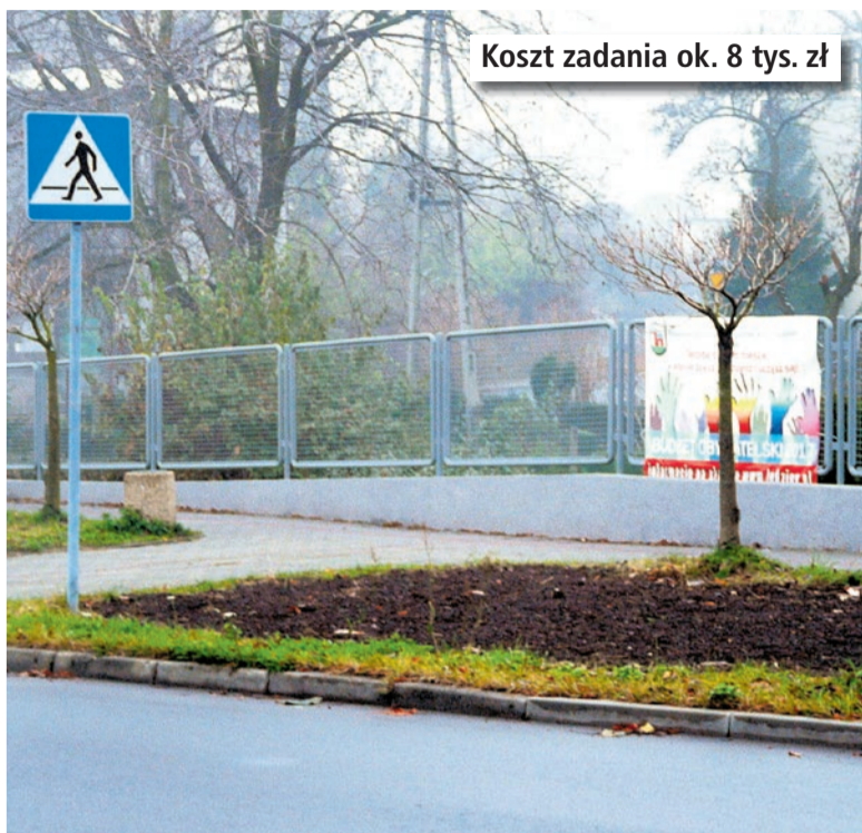
Koszt zadania ok. 8 tys. zł

Ogrodzenie znajdujące się na ulicy Lędzińskiej, w pobliżu ronda zostało wymienione na nowe, estetyczne.