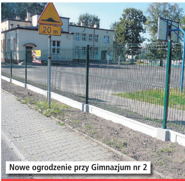
Nowe ogrodzenie przy Gimnazjum nr 2