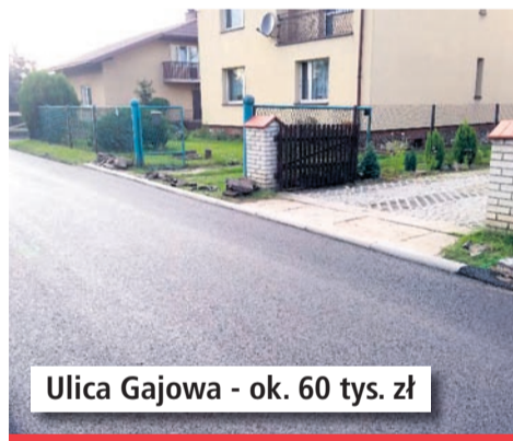
Ulica Gajowa - ok. 60 tys. zł