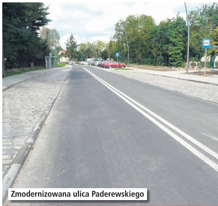
Zmodernizowana ulica Paderewskiego

Inwestycja ta realizowana była w ramach Programu Rozwoju Gminnej