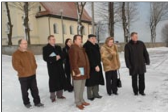
Delegacja czeska wraz z reprezentacją Miasta Łędziny podziwia panoramę rozpościerającą się z Górkę Klemensową