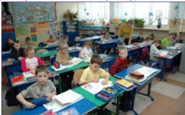
Klasa 1 b podczas zajęć lekcyjnych

W swej pracy dydaktycznej i wychowawczej nauczyciele kierowali się mottem: „Nasza szkoła przewodnikiem dziecka w jego wędrówce po świecie wartości, wiedzy i umiejętności.”