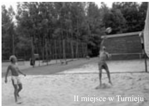
II miejsce w Turnieju

„Nie ma to jak rodzina” - o wartości rodzinnych więzów przekonali się również uczestnicy tegorocznego I Powiatowego Turnieju Siatkówki Piłkowej. Dwie spośród finałowych drużyn