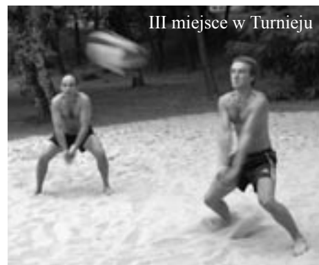
III miejsce w Turnieju