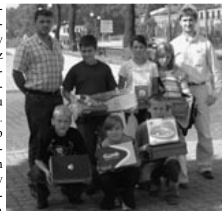
Zwycięzcy Turnieju Pływackiego wraz z organizatorami - członkami Stowarzyszenia Na Rzecz Rozwoju Sportu

Nie najlepsza pogoda w sierpniu spowodowała trudności w przeprowadzeniu imprez sportowych zaplanowanych przez Stowarzyszenie Na Rzecz Rozwoju Sportu na ten miesiąc. Słońce nie zapomniało jednak całkowicie o tegorocznych wakacjach i zaświeciło jeszcze w ostatni wakacyjny weekend. Nagła poprawa pogody pozwoliła na natychmiastowe zrealizowanie przynajmniej