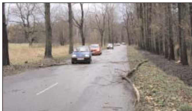
ul. Jagiellońska - połamane przez wichurę konary drzew

Ta fatalna w skutkach anomalia pogodowa nie oszczędziła także miasta Lędziny. "Pogodowy horror" rozpoczął się ok. godz. 11:00 i trwał do ok. godz. 16:00. Te pięć godzin wystarczyło, aby całe Lędziny pogrążyły się w ciemnościach. c.d. na stronie 3 >>>