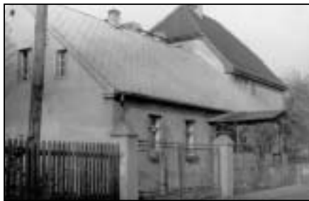
Nieistniejący już budynek szkoły w Goławcu.