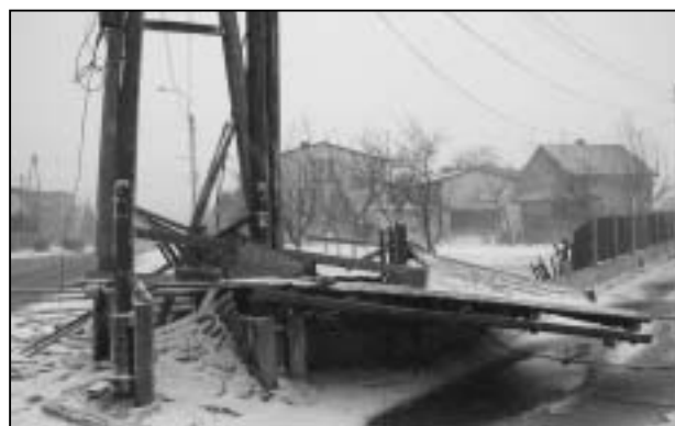
ul. Łędzińska - zerwany przez wichurę dach - gdyby nie słupy elektryczne znalazłby się na drodze stwarzając zagrożenie dla uczestników ruchu.

Pierwszym efektem wichury były połamane drzewa, które zablokowały ruch na ulicach: Jagiellońskiej, Paderewskiego, Ks. Kontnego i trasie DK 1. Uszkodzone zostały linie średniego napięcia Blych – Urbanowice oraz od ulicy Gajowej, wzdłuż Ogródków Działkowych do SP3. Ich naprawa zakończona została dopiero w niedzielę późnym popołudniem. Na ulicy Ekonomicznej przewrócone drzewo zniszczyło ogrodzenie, jednak szczęściem było, iż nie runęło ono na jeden ze stojących obok domów, gdyż wtedy straty byłyby jeszcze większe. Inne powalone przez wichurę drzewo zablokowało wjazd na parking przy kościele p.w. Św. Anny od ulicy Ks. Głucha. Uszkodzeniu uległy cztery dachy, w tym najpoważniej w budynkach mieszkalnych przy ulicy Łędzińskiej i Zawiszy Czarnego. Duża część Łędzin pozostawała bez prądu do