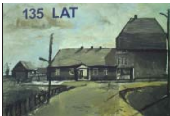
Obraz namalowany przez nauczyciela plastyki Szkoły Podstawowej Nr 4 w Goławcu - Pana Artura Kolba.

W dniu 06.11.2004 w Goławcu obchodzono szczególnie uroczyste ważne, a wręcz historyczne wydarzenie - 135-lecie Szkoły Podstawowej Nr 4 w Goławcu.