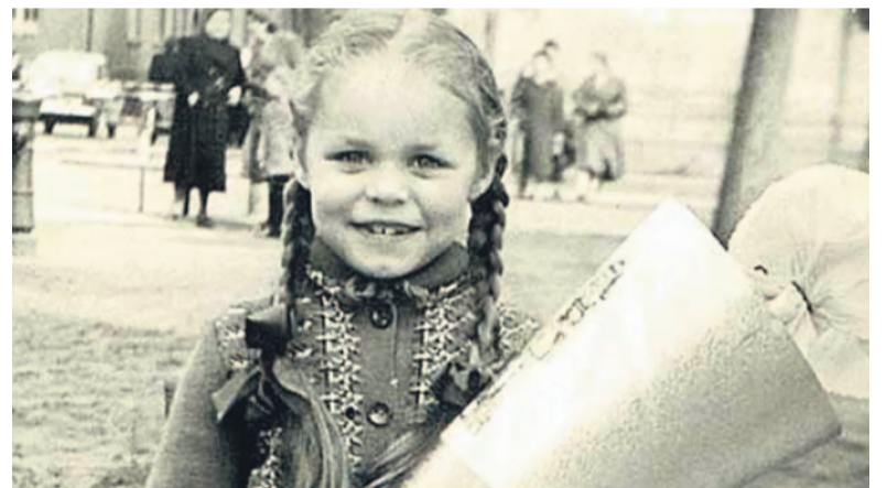
Pierwszoklasistka z tytą. Lata 50. Zbiory prywatne.

– W różnych miastach robimy to różnie. Czasami o wykaz biednych rodzin, w których jest pierwszoklasista, prosimy MOPS. Czasami dyrektorów szkół. My w Łędzinach zdecydowaliśmy, że nie chcemy żadnej ścieżki administra-