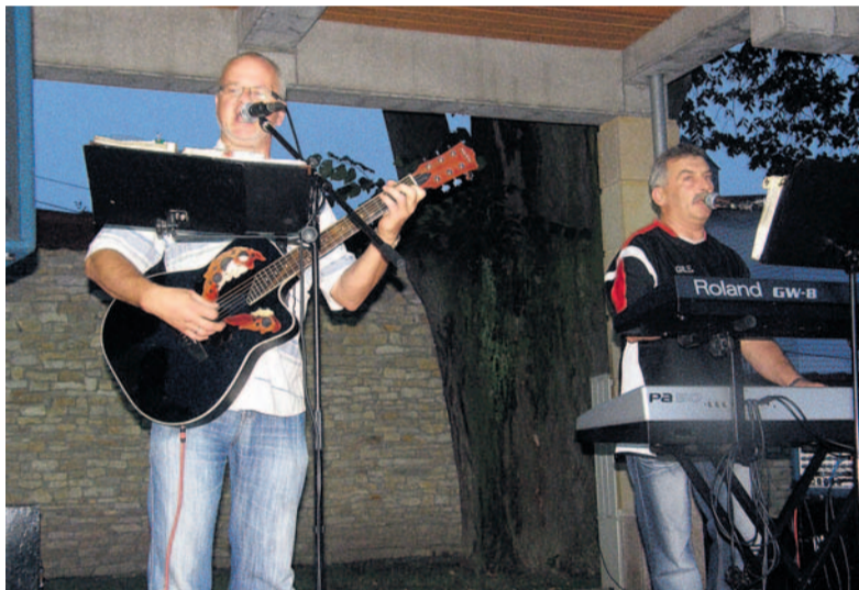
Gest czyli Szwagry.

Druga część zawierała utwory kojarzone z repertuarem biesiadnym, np. „Szałała szalała” zespołu Krywań, „Guantanamo” z polskim tekstem, czy klasyk gatunku – „My cyganie (ore ore)”.