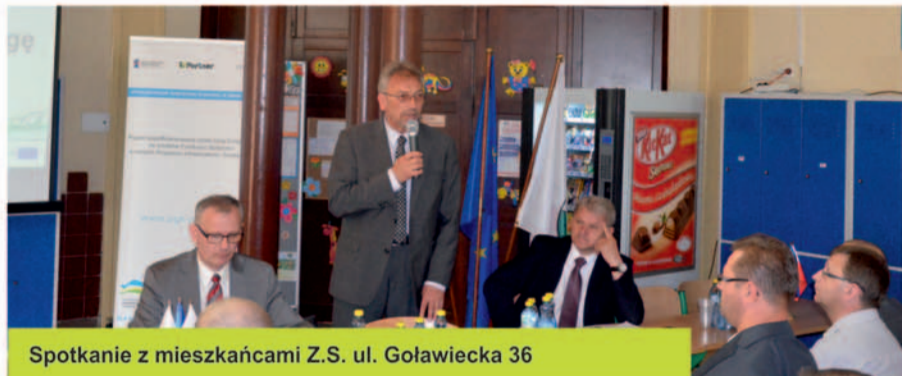
Spotkanie z mieszkańcami Z.S. ul. Goławiecka 36

Podczas spotkań zaprezentowano w formie prezentacji multimedialnej i omówiono dokładnie cele i etapy realizacji Projektu z podziałem na poszczególne kontrakty i zadania. Przedstawiono dotychczasowy przebieg prac i założenia na najbliższe miesiące.