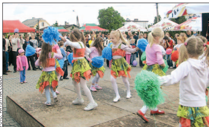
Wesoła zabawa dla wszystkich.