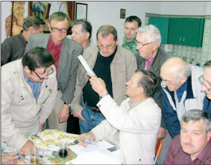
Sprzedż leków dla pszczoł w siedzibie koła pszczelarzy.

Do rolników kierujemy serdeczny apel, aby zaniechali jakiegokolwiek opryskiwania pól środkami chemicznymi w porze południowej. To wtedy właśnie pszczoły najintensywniej poszukują pyłków kwiatowych i najbardziej są narażone na szkodliwe oddziaływanie chemikaliów