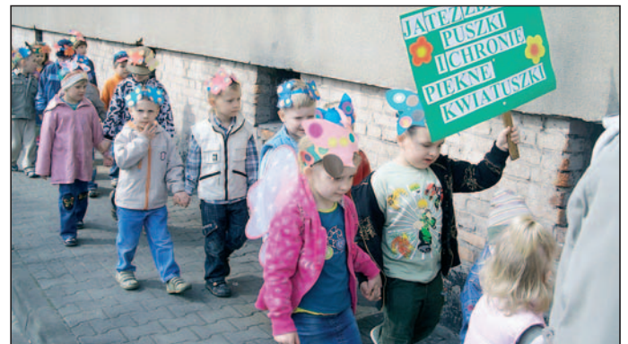
„Aluzbieracze” wyruszają na spacer.

Tym sposobem wizytówką Przedszkola nr 2 stał się jego piękny ogród. Starannie dobrana roślinność mieniąca się odcieniami zieleni, kształtem i barwnym kwiatostanem wzbudza zainteresowanie przechodniów, dodaje niepowtarzalnego uroku, wzbogaca cen-